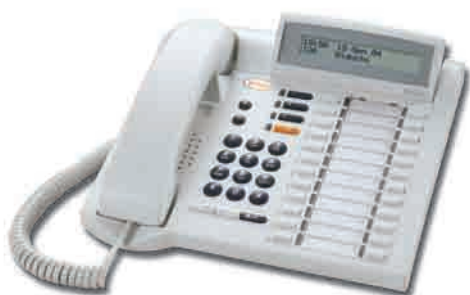
SAEfon CL 28D