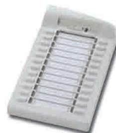
Modulo aggiuntivo SAEfon DSS