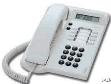
SAEfon CL 08D