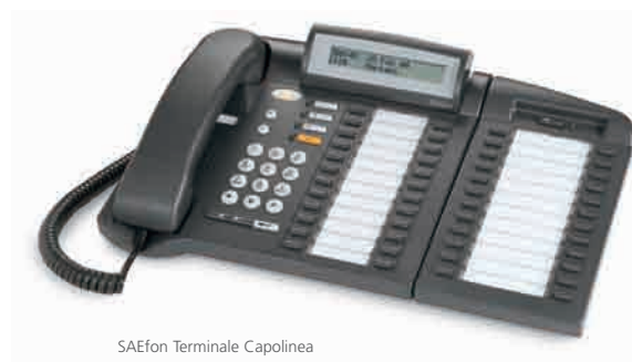
SAEfon Terminale Capolinea