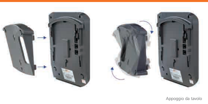
Appoggio da tavolo

SAEfon CL è caratterizzato da un design molto pulito ed è una gamma di telefoni semplici da utilizzare.